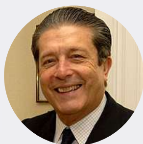
Dr. Federico Mayor Zaragoza

Presidente de la Fundación Cultura de Paz. Exdirector General de la UNESCO (1987 - 1999). (POR CONFIRMAR)