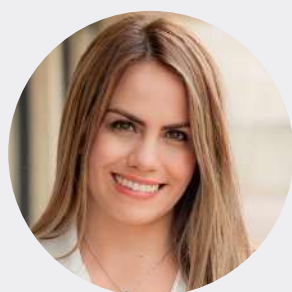
Nohora Mercado Caruso

Exsecretaria de Gobierno y Transformación Digital de Perú.